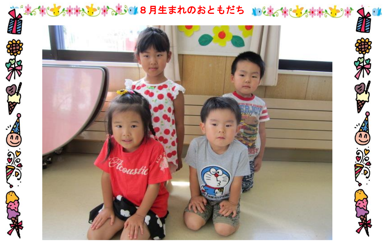
8月生まれのおともだち

ひよこ 暑い日が続くと食欲が落ちたり、睡眠が十分にとれず体調を崩しやすくなります。沐浴や水遊びを楽しみながらゆっくりと健康に過ごしていきたいと思います。また、ハイハイや一人歩きなど活動範囲も広がっているので安全に気をつけていきたいです。